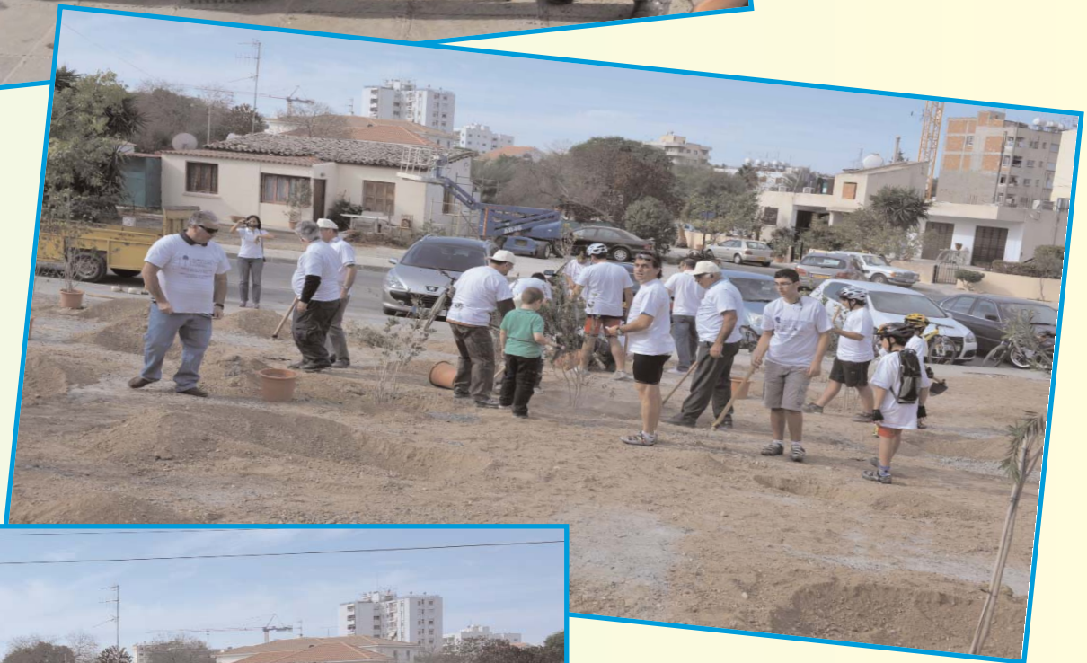
Συγμιότυπα από την δεντροφύτευση