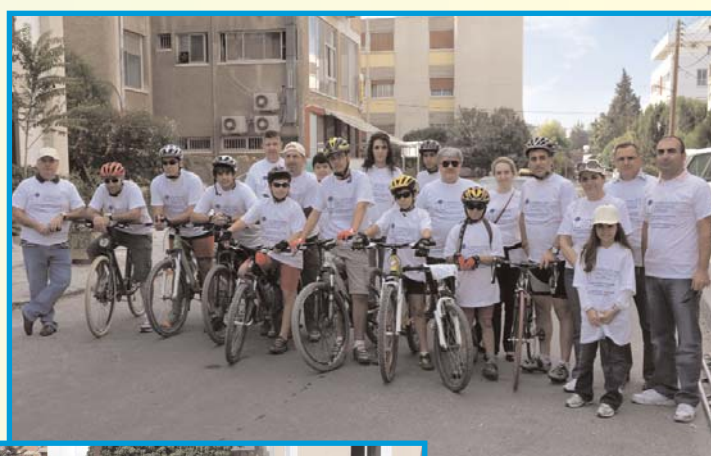
Συγκρότημα από την ποδηλατική εκδήλωση