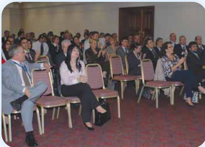
Οι Σύεδροι κατά τη διάρκεια της 2 ης Ανοικτής Συζήτησης