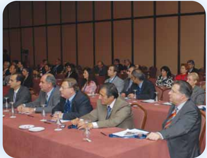
Οι Συνέδροι παρακολουθούν με ενδιαφέρον τα θέματα του Συνεδρίου