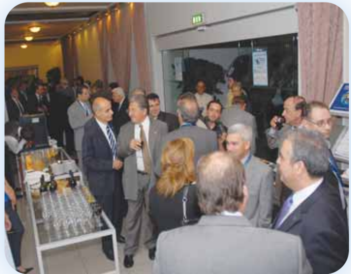
Η δεξίωση στον εκθεσιακό χώρο του Συνεδρίου