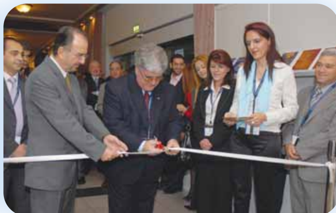
Ο Πρόεδρος του Ασφαλιστικού Ινστιτούτου Κύπρου τελεί τα εγκαίνια της Έκθεσης του Συνεδρίου