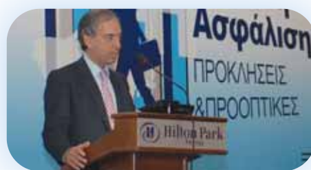
Ο Υπουργός Οικονομικών κ. Χαρίλαος Σταυράκης απευθύνει χαιρετισμό

Εισαγωγή στην έναρξη του Συνεδρίου, την Πέμπτη 13 Νοεμβρίου, έκανε ο Προεδρεύοντας των εργασιών του Συνεδρίου και Αντιπρόεδρος του Ασφαλιστικού Ινστιτούτου Κύπρου κ. Χαράλαμπος Χαμπουρής. Κατά τη διάρκεια του Συνεδρίου, χαιρετισμούς απηύθυναν ο Υπουργός Οικονομικών κ. Χαρίλαος Σταυράκης, η Έφορος Ασφαλίσεων κ. Βικτώρια Νάταρ, ο Πρόεδρος του Ασφαλιστικού Ινστιτούτου Κύπρου κ. Σώτος Κυριακίδης, ο Πρόεδρος του Συνδέσμου Ασφαλιστικών Εταιρειών Κύπρου κ. Φίλιος Ζαχαριάδης και ο Πρόεδρος του Συνδέσμου Επαγγελματιών Ασφαλιστικών Διαμεσολαβητών κ. Γιώργος Λιόλης.