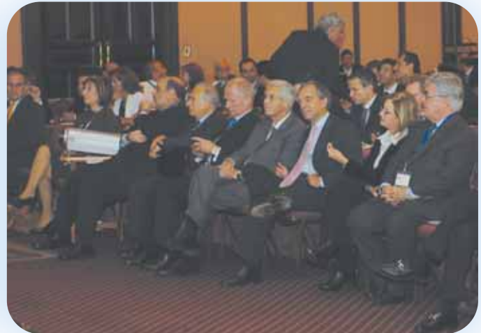
Επίσημοι προσκεκλημένοι παρακολουθούν το Συνέδριο