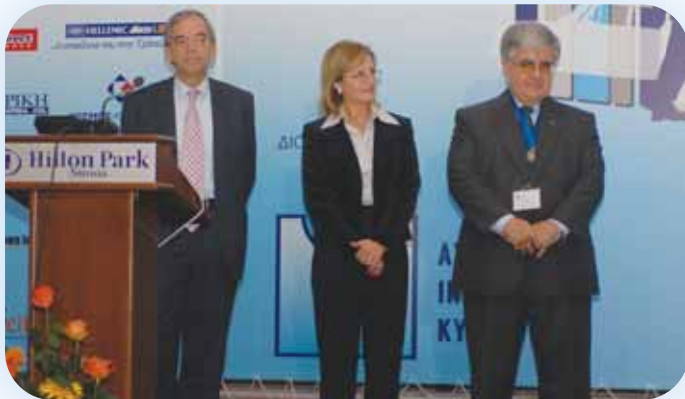
Ο Υπουργός Οικονομικών κ. Χαρίλαος Σταυράκης, η Έφορος Ασφαλίσεων κ. Βικτώρια Νάταρ και ο Πρόεδρος του Ασφαλιστικού Ινστιτούτου Κύπρου κατά τη διάρκεια της απονομής των τιμητικών διακρίσεων στους πρώην Προέδρους του Ασφαλιστικού Ινστιτούτου