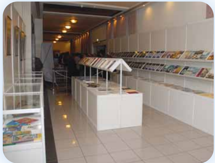
Η Έκθεση «Ασφαλιστικού Βιβλίου»