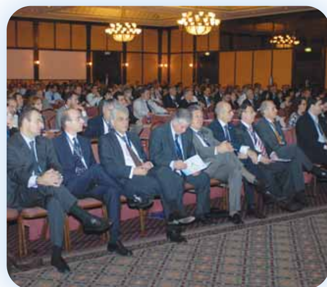
Στιγμιότυπο από το Συνέδριο