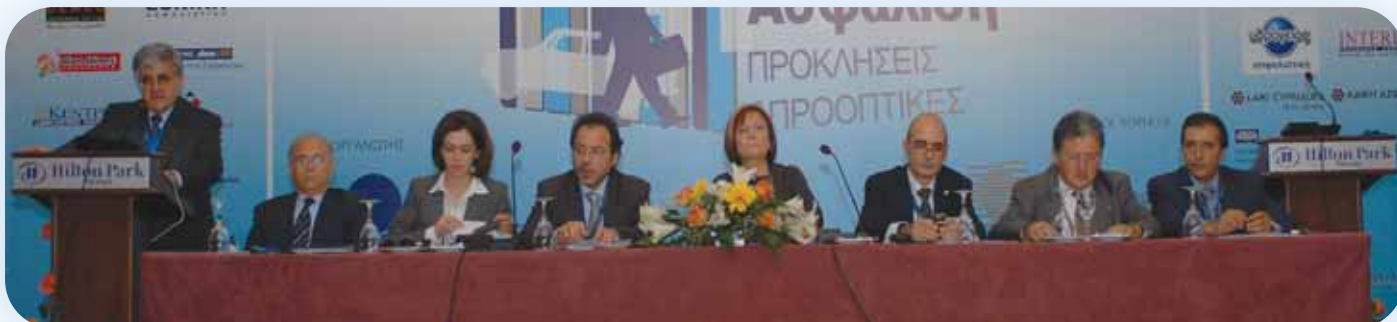
Στιγμιότυπο της 1ης Παράλληλης Παρουσίασης

Στο Συνέδριο παρουσιάστηκαν δύο παράλληλες συνεδρίες ανοικτής συζήτησης. Οι Συνέδριοι είχαν την ευκαιρία να παρακολουθήσουν μία εκ των δύο συζητήσεων που είχαν προεπιλέξει στο Συνέδριο.