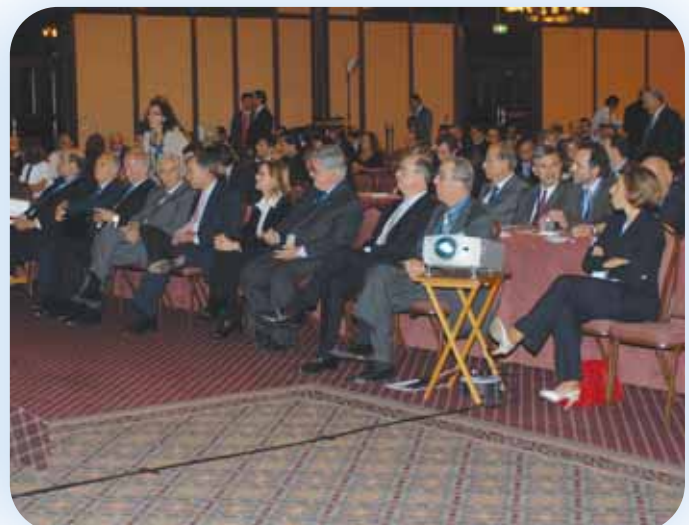
Στιγμιότυπο από το Συνέδριο