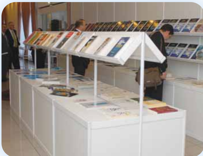
Στιγμιότυπο από την Έκθεση «Ασφαλιστικού Βιβλίου»