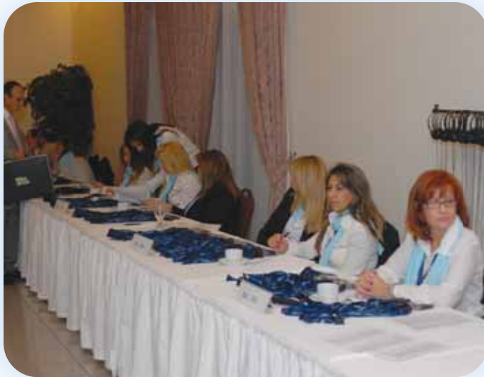
Στιγμιότυπο από τη διάρκεια της εγγραφής των Συνέδρων