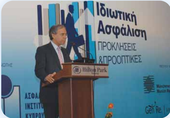
Ο Υπουργός Οικονομικών κ. Χαρίλαος Σταυράκης