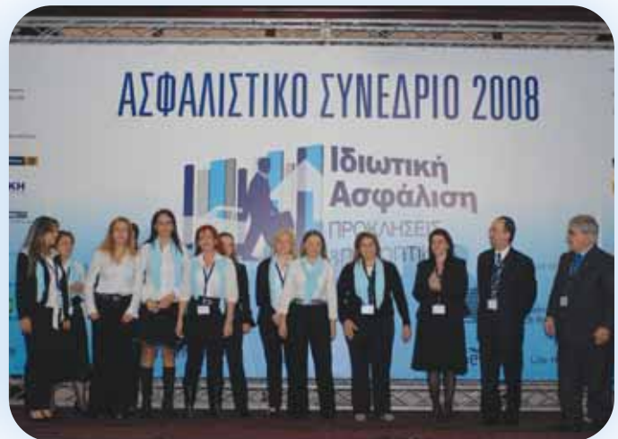
Η οργανωτική επιτροπή του Ασφαλιστικού Συνεδρίου 2008